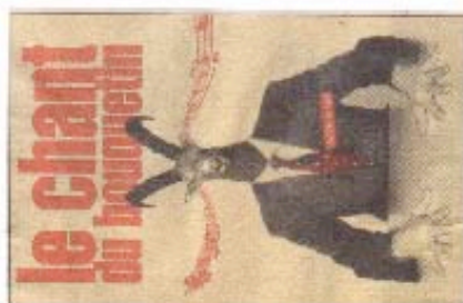
Au Loup. Un spectacle qui chatouille les racines. (mty)

Le chant du bouquetin par la Cie Consaïre Sanglot au Théâtre du Loup du 1er au 11 juin. Rés. 022 301 31 00.